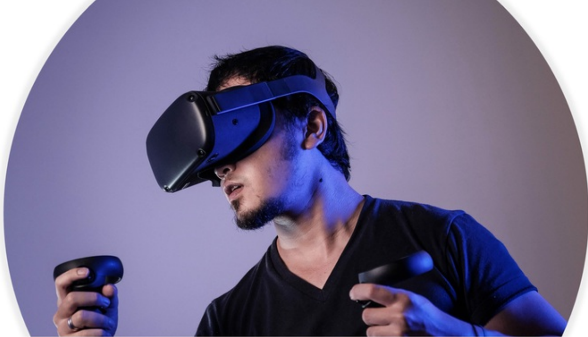
GENERATIVE KI MIT OPEN AI, CHAT GPT UND GOOGLE BARD: WIE(SO) FUNKTIONIERT DAS SO GUT?